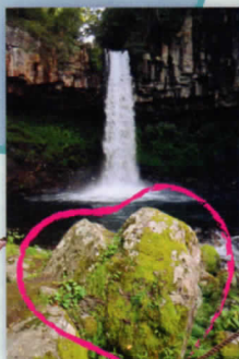
ハート岩は人気撮影スポット